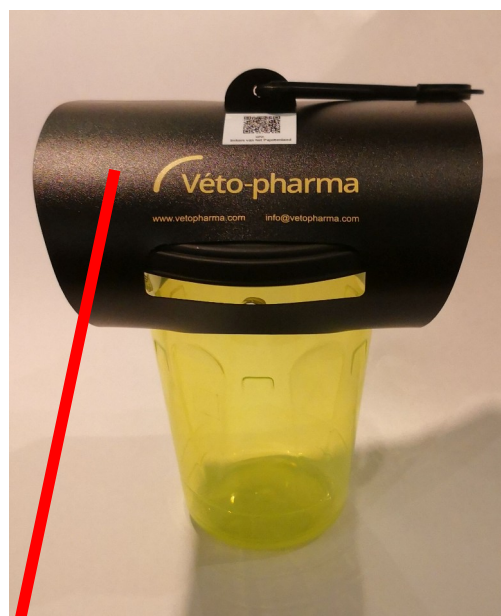
Tunnel voor regenbescherming