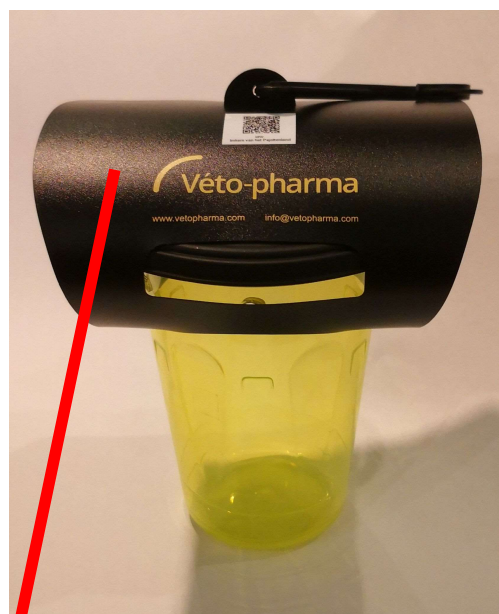
Tunnel voor regenbescherming