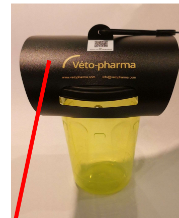
Tunnel voor regenbescherming