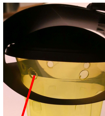
Extra gaten voor wespen en vliegen

De val draagt een etiket met een QR-code , deze code leidt naar onze AZH pagina waar ook de laatste versie van deze handleiding beschikbaar is. Op dezelfde pagina vind je heel wat info rond gebruik en aanmaak van lokstof,